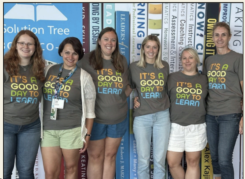
Un grupo de nuestros profesores de BDMS estuvieron en un viaje de aprendizaje este verano en el Instituto de Comunidades Profesionales en Madison