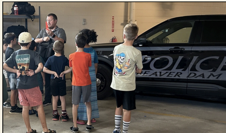
Los estudiantes de nuestra clase de Introducción al Trabajo Policial pudieron hacer un viaje al Departamento de Policía de Beaver Dam durante la última semana de las clases de verano

“Se debe autorizar al Distrito Escolar Unificado de Beaver Dam, condado de Dodge, Wisconsin, a emitir, de conformidad con el Capítulo 67 de los Estatutos de Wisconsin, bonos de obligación general por un monto que no exceda los $107,000,000 con el propósito público de pagar el costo de un proyecto de mejora de edificios e instalaciones escolares que consiste en: construcción de un nuevo edificio y campus de escuela secundaria, incluidas mejoras en el espacio comunitario y deportivo; construcción de ampliaciones, renovaciones y mejoras en la infraestructura del edificio en la escuela primaria Washington; seguridad, protección, accesibilidad ADA, recreación y mejoras del sitio en todo el distrito; posible remoción total o parcial del edificio de la escuela secundaria existente; y adquisición de mobiliario, accesorios y equipos?”